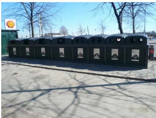
Kuva 1. Syväkeräys toisiinsa kytketyillä as- tioilla.

EKJH:n hallitus valitsi ekopisteverkoston keräysjärjestelmäksi syväkeräyksen toisiinsa kytkettävillä neliömalli- silla astioilla (Kuva 1). Mikäli syväkeräysastioiden asentaminen ei ole mahdollista niin käytetään pohjasta tyh- jennettäviä metalliastioita (ns. Swedex - tyyppinen tai vastaava, Kuva 2).