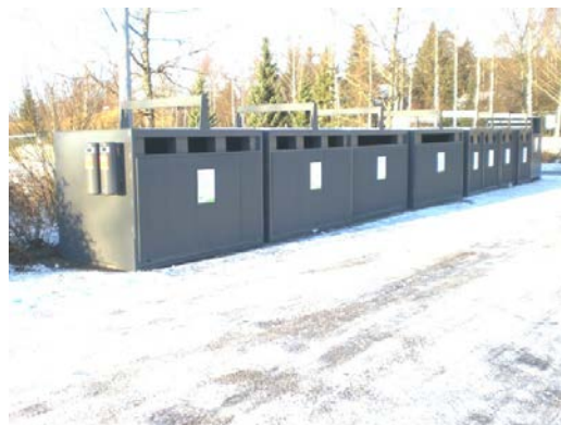
Kuva 2. Pohjasta tyhjennettävä metalliastia (ns. Swede- box).